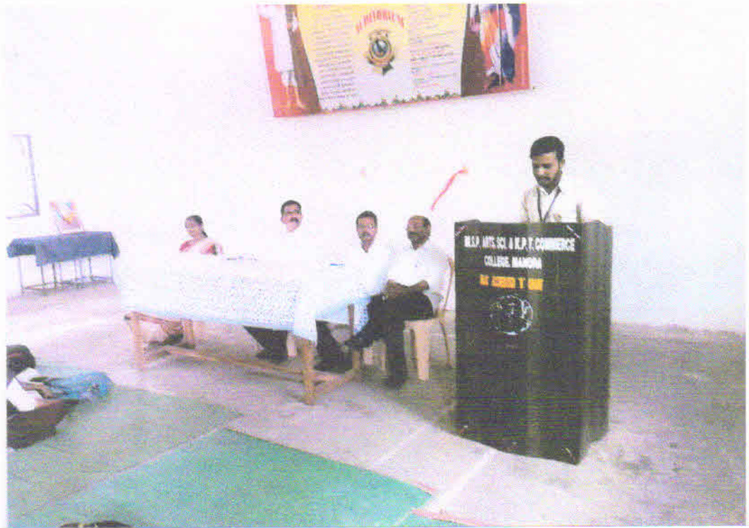
वाचन प्रेरणा दिनानिमित्त वर्तमानपत्रातील अग्रलेख वाचतांना एक विद्यार्थी