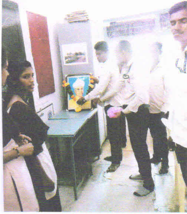
स्वयंशासन दिनानिमित्त डॉ. सर्वपल्ली राधाकृष्णन यांच्या प्रतिमेला पुष्पहार अर्पण करतांना