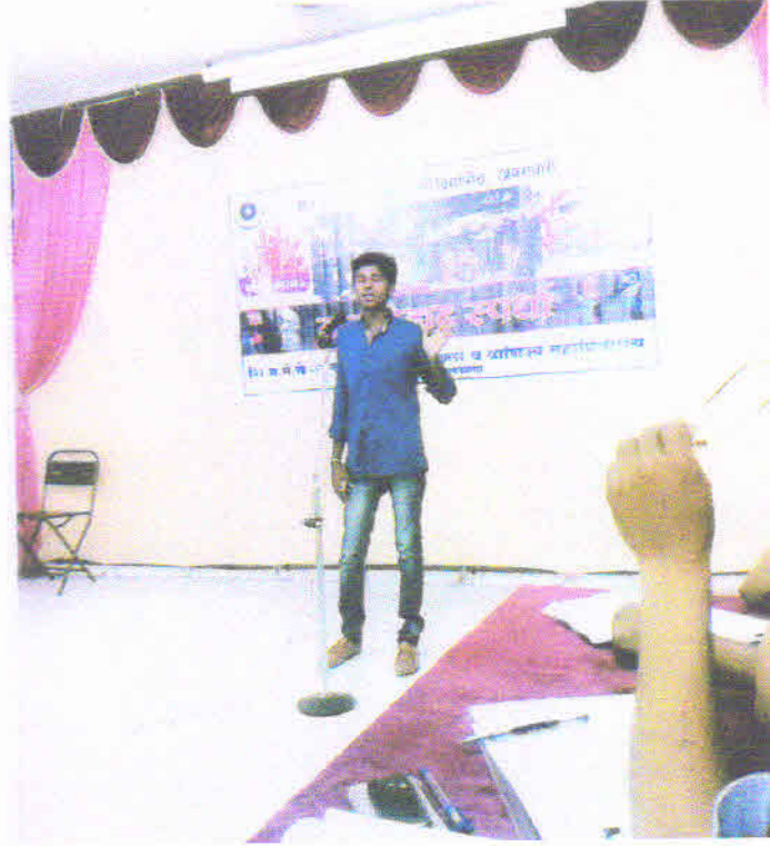
सं.गा.बा. अमरावती विद्यापीठाने आयोजित केलेल्या युवा महोत्सवातील वादविवाद स्पर्धेत आपली बाजू मांडतांना महाविद्यालयाचा विद्यार्थी