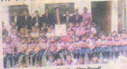
मानोरा : लोकमान्य टिळक जयंतीप्रसंगी उपस्थित विद्यार्थी.