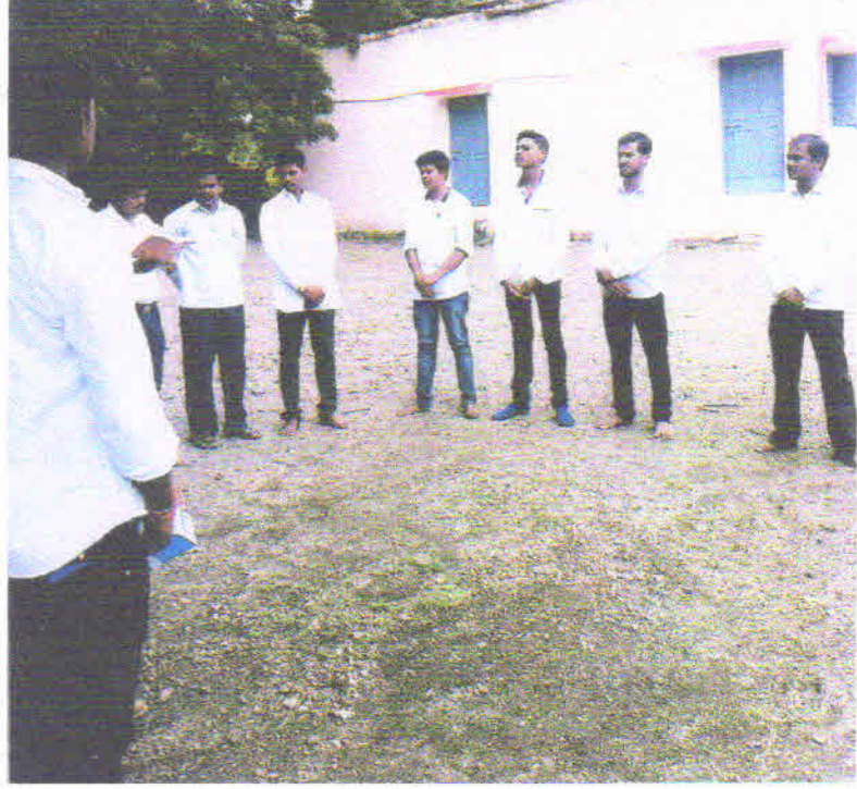
स्वाध्याय परिवारातील सदस्य पथनाट्य सादर करतांना