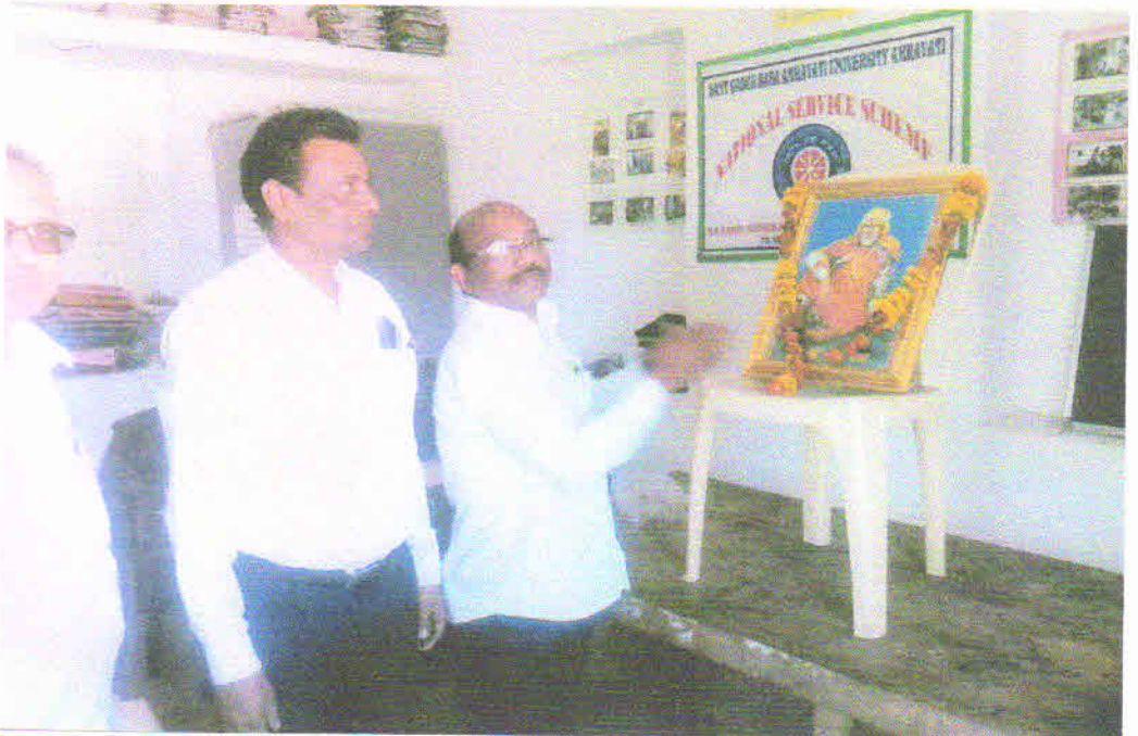
संत गाडगेबाबाच्या प्रतिमेला अभिवादन करतांना