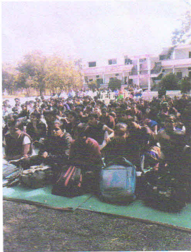
व्याख्यानमालेतील व्याख्यानाचा आस्वाद घेतांना महाविद्यालयाचे विद्यार्थी