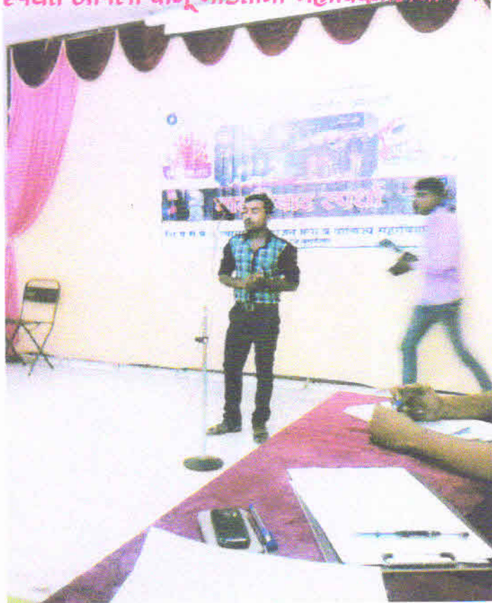
युवा महोत्सवातील वादविवाद स्पर्धेत भाग घेतांना महाविद्यालयाचा विद्यार्थी