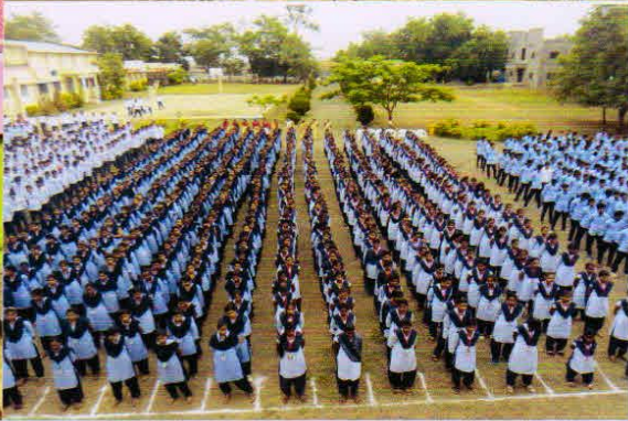
Photo:Celebration Of Republic Day at College