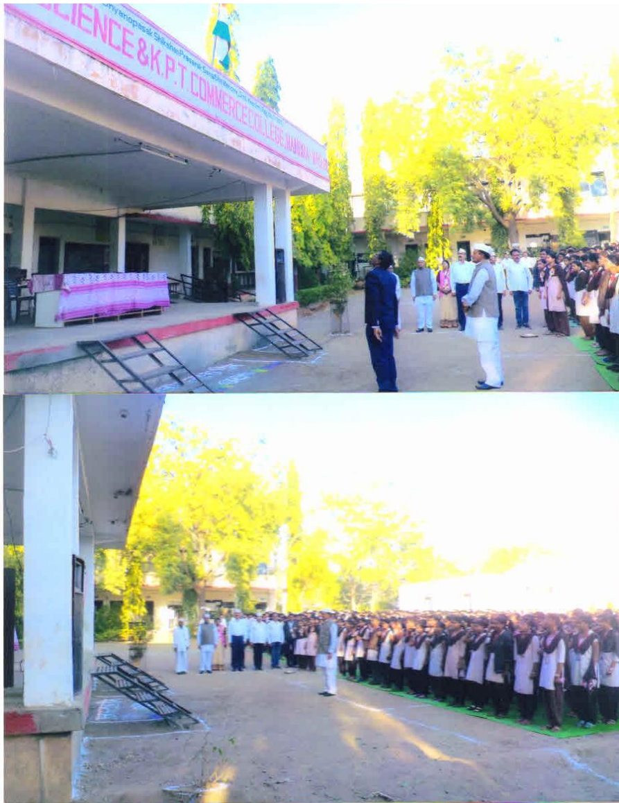
Photo:Celebration Of Independence Day at College