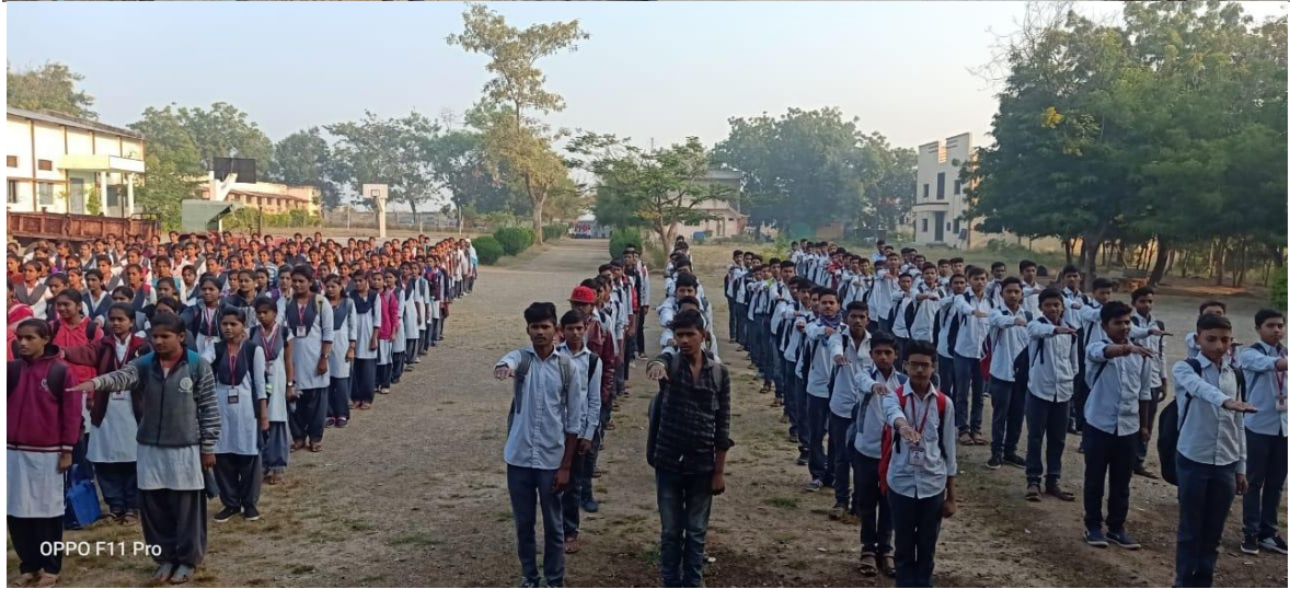
Photo: Celebration of Constitution Day