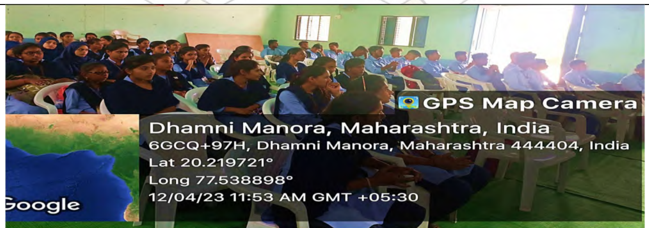
Student participants in Workshop