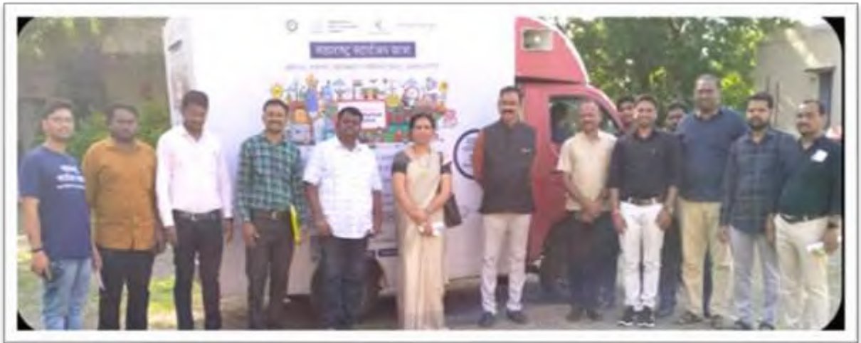
Photograph of Start Up Team with Start Up Yatra Rath (Van) & College Staff.