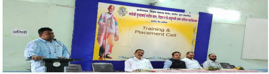
मानोरा : प्रशिक्षण व भरती मेळाव्यात मार्गदर्शन करताना मान्यवर.