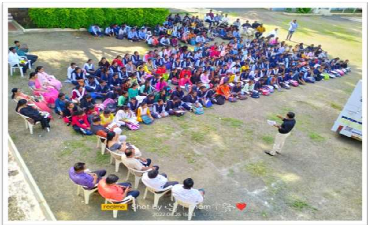
Mr. Bhose introducing the core theme of event to the students.